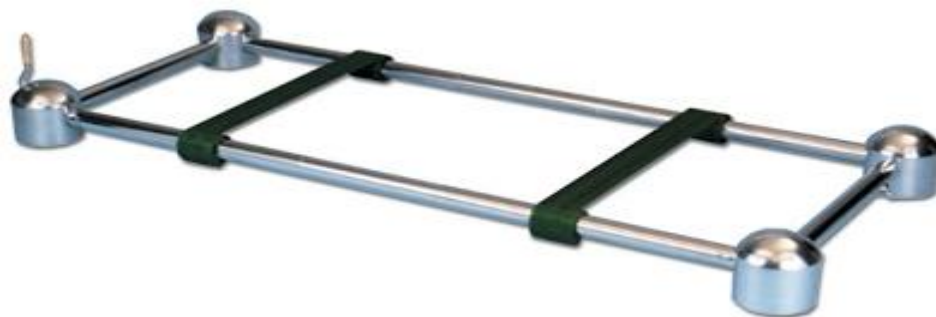
*Uređaj za spuštanje lijesa u grob

Zbog uvođenja nove djelatnosti ukopa, u planu je nabava uređaja za spuštanje lijesa u grob te prethodno spomenuto zapošljavanje dva izvršitelja na radnom mjestu "Grobar".