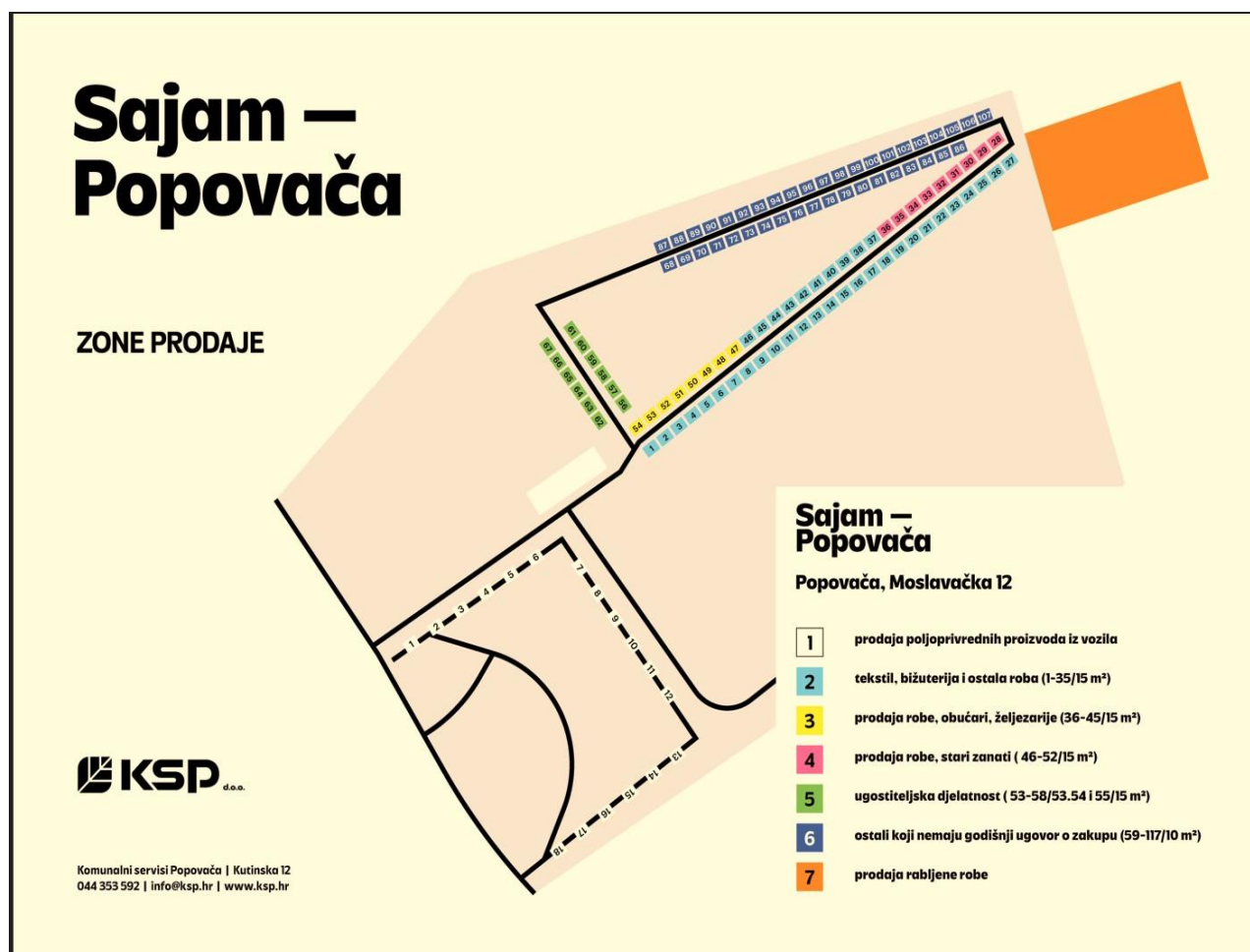
*Skica rasporeda prodajnih mjesta na sajmu

Prema shemi organizacije prodavatelji su raspodijeljeni u kategorije prema djelatnostima, dok je prostor za prodaju podijeljen u zone po navedenim kategorijama i iznajmljujemo ga prema m 2 . Trenutno se na prostoru sajma nalazi 125 prodajnih mjesta. U narednoj godini planira se asfaltirati podloga za prodaju proizvoda iz vozila, podloga kod svih prodajnih pozicija kao i nogostup u Moslavačkoj ulici.