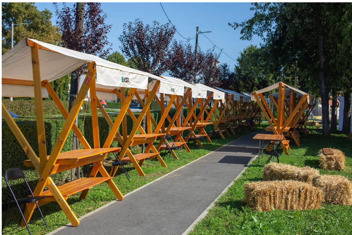
* drveni štandovi KSP-a