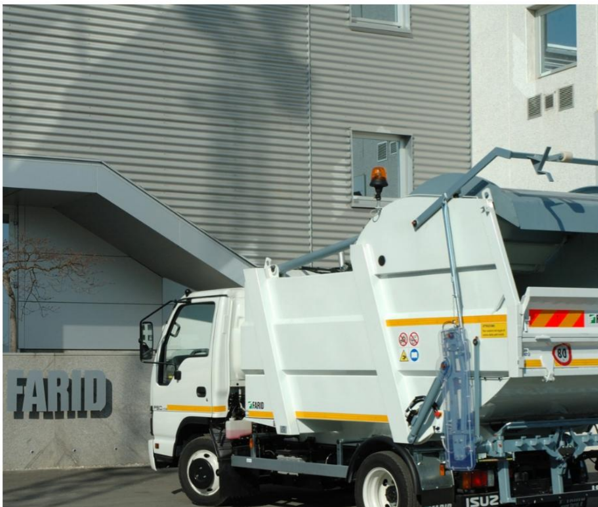
* Električno vozilo

S obzirom na konstantno povećanje potrošača te potrebe odvajanja prikupljenog otpada u 2026. godini provest će se nabava jednog električnog vozila C kategorije za odvojeno prikupljanje otpada za čiju je nabavu odobreno 68.800,00 eura bez PDV-a od strane Fonda za zaštitu okoliša i energetske učinkovitost. Odobrena sredstva čine 40% procijenjenih i opravdanih troškova nabave vozila. Također, kroz 2026. godinu nastavit će se provoditi kontinuirana edukacija svih građana o potrebi odvajanja otpada kroz društvene mreže, letke i radionice.