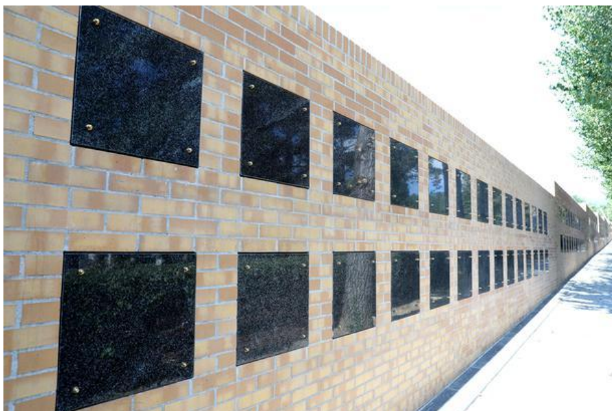
*Primjer Kolumbarijskog zida

Unutar postojećeg groblja u Popovači u narednoj godini planiramo izgraditi jednostrani (koristi se samo s jedne strane) tzv. Kolumbarijski zid s nišama za urne, koji bi istovremeno bio i dio ograde groblja. Na taj način bi omogućili korisnicima da urne odlažu u niše predviđene za urne koje zauzimaju manje mjesta nego kada se odlažu u grobno mjesto.