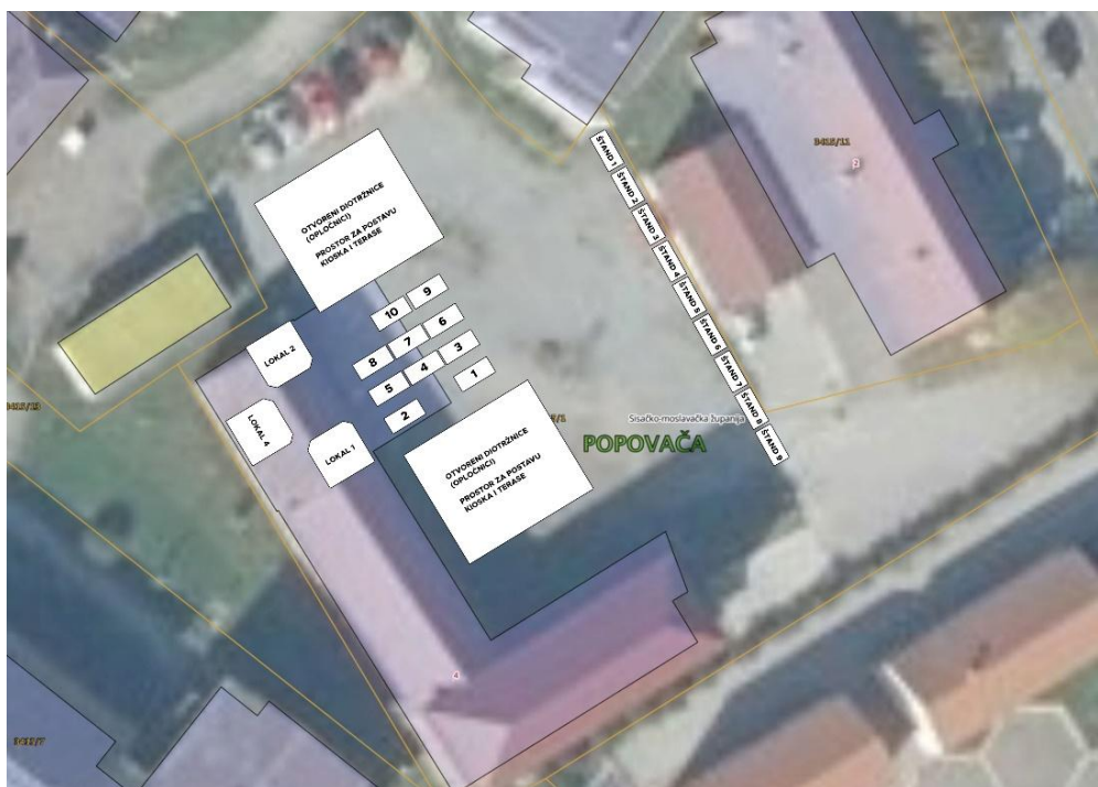
*Skica rasporeda prodajnog prostora na tržnici

Vanjski prodajni prostor u zakupu je ovisno o sezonalnosti prodaje te se prodajna mjesta na tom dijelu tržnice iznajmljuju po upitima domaćih proizvođača.