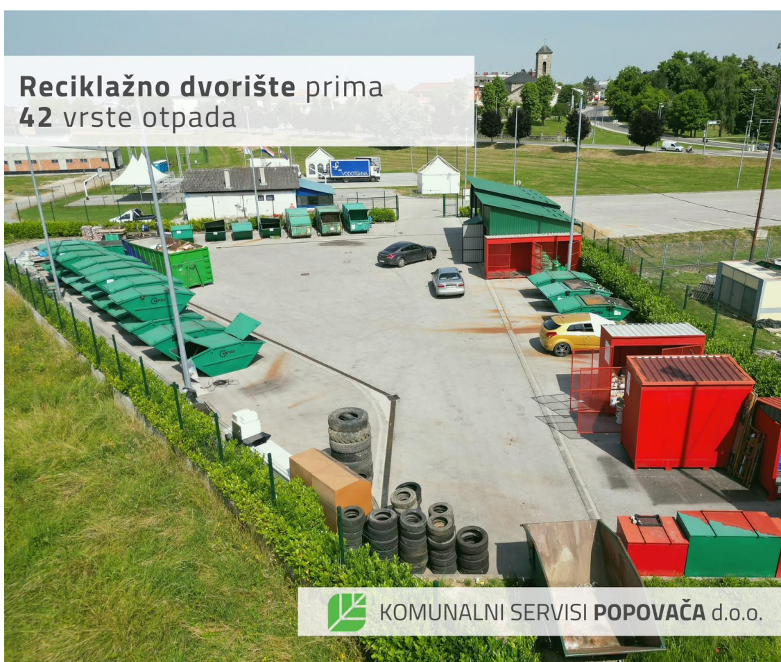
* Reciklažno dvorište

manjih količina posebnih vrsta otpada. Kako bi se osigurao kvalitetan pristup reciklažnom dvorištu, izgrađena je pristupna cesta i pripadajuće parkiralište sa 70-ak parkirnih mjesta te sustav odvodnje i nova javna rasvjeta ovog prostora. Na reciklažnom dvorištu odlažemo ravno staklo, ambalažno staklo, metalnu ambalažu, metali crni, folijarnu plastiku, PS krutu plastiku, PE krutu plastiku, EE električni, papir bez primjesa, kartonsku i papirnu ambalažu, drvo komadno, automobilske gume, EE elektronički, tekstil, metali obojani, problematični otpad iz domaćinstva, zapaljive tekućine, odjeću, jestiva ulja i masti, lijekove, boje, tinte i glomazni otpad.